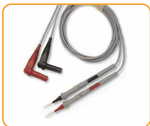
34133A Комплект прецизионных испытательных щупов