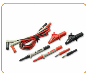
U1661A Расширенный комплект измерительных щупов