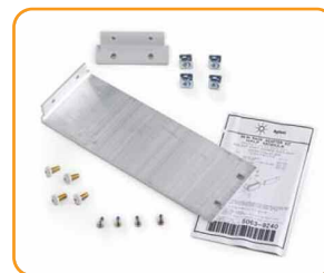
U3400A-1CM Комплект для монтажа в стойку