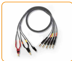
11059A Набор кельвиновских пробников