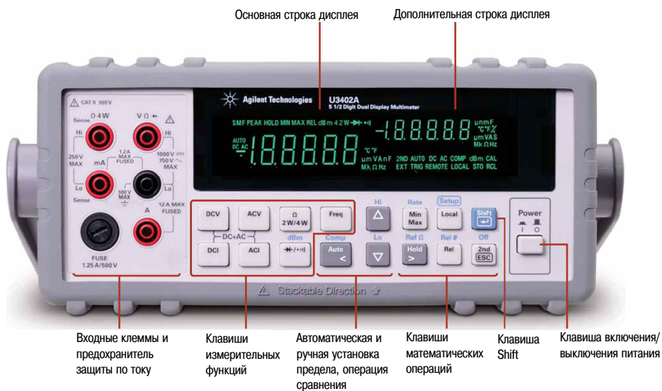
Рисунок 1. Передняя панель мультиметра U3402A. Передняя панель модели U3401A имеет аналогичный вид, за исключением незначительных отличий в расположении клавиш выбора некоторых функций. Для получения более подробной информации следует обратиться к руководству по эксплуатации и обслуживанию мультиметров U3401A (User's and Service Guide U3401-90001).