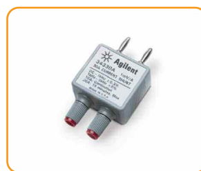
34330A Токовый шунт на 30 А