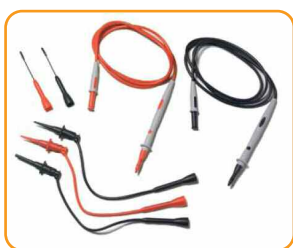
34138A Комплект измерительных щупов